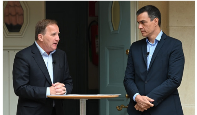
El presidente de Gobierno español, Pedro Sánchez, y el primer ministro sueco, Stefan Löfven, comparecen ante los medios en la residencia vacacional de Harspund (Suecia).-14 de junio de 2020.

Uno de los elementos que está contribuyendo a cambiar la relación bilateral es la creciente comunidad española en Suecia, aprovechando las oportunidades de trabajo que ofrece un mercado laboral con, prácticamente, pleno empleo en los trabajos cualificados y de mayor formación. La colonia española en Suecia ha crecido a un ritmo sostenido la última década, hasta situarse