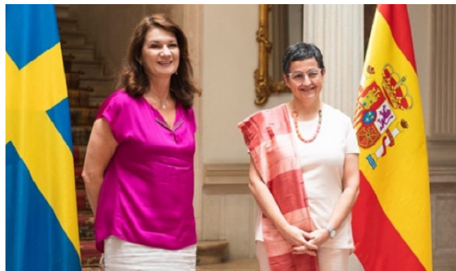
La anterior ministra de Asuntos Exteriores Unión Europea y Cooperación González Laya junto a su homóloga Ann Linde.-Palacio de Viana (Madrid).-7 de julio de 2020.